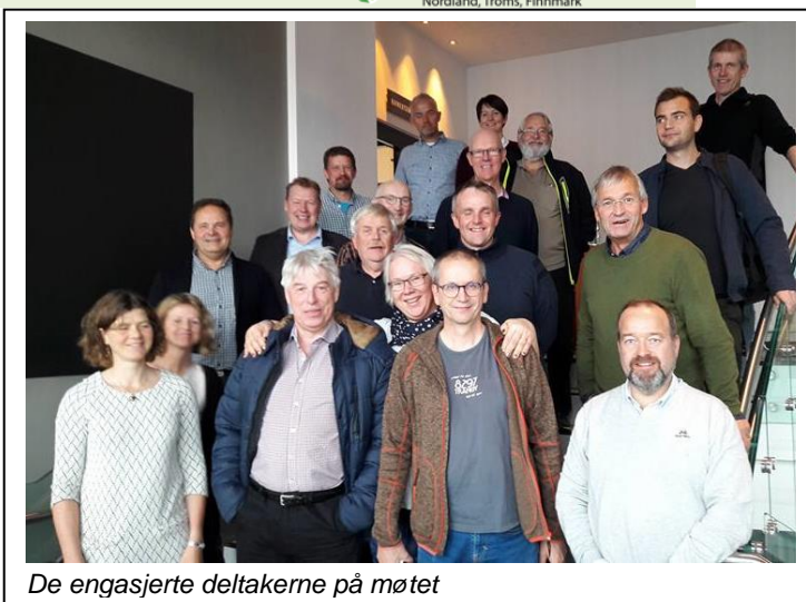
De engasjerte deltakerne på møtet

For å se hele rapporten og presentasjonen av funn som ble vist på seminaret, se nyhetssak her .