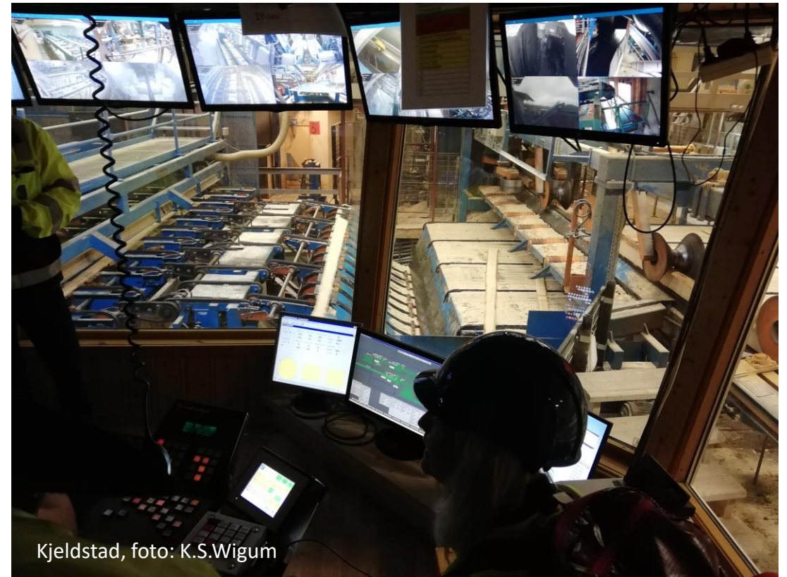
Kjeldstad, foto: K.S.Wigum