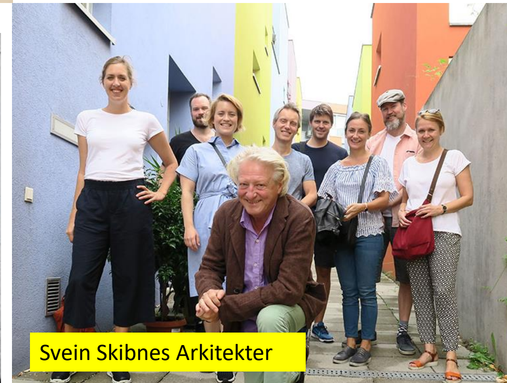
Svein Skibnes Arkitekter