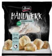
Mindre poser for å begrense unødvendig luft Plastbesparelse: 3 tonn

Mellom 2018 og 2021 reduserte vi bruken av plast med 63 tonn = 28%