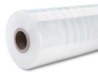
Tynnere og mer elastisk strekkfolie rundt paller Plastbesparelse: 25 tonn