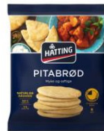
Byttet til resirkulerbar monoplast i frysedisken Gjør gjenvinning enkelt for forbruker